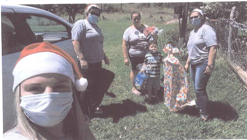
FIGURA 1 - ENTREGA PRESENTES PARA ALUNO DA EMEI FAVINHO DE MEL