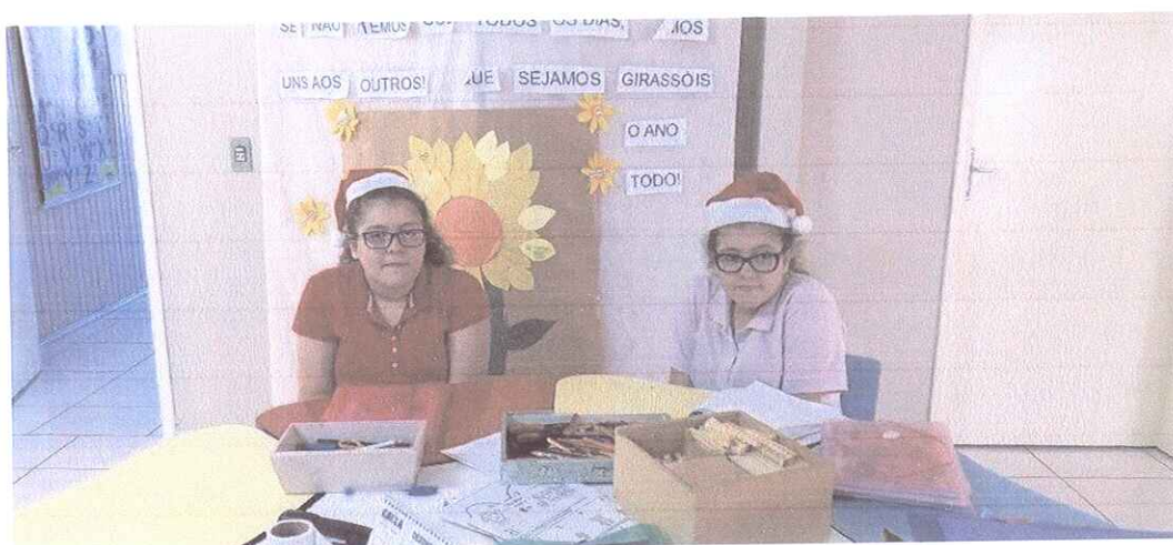
FIGURA 2 - ATENDIMENTO PEDAGÓGICO