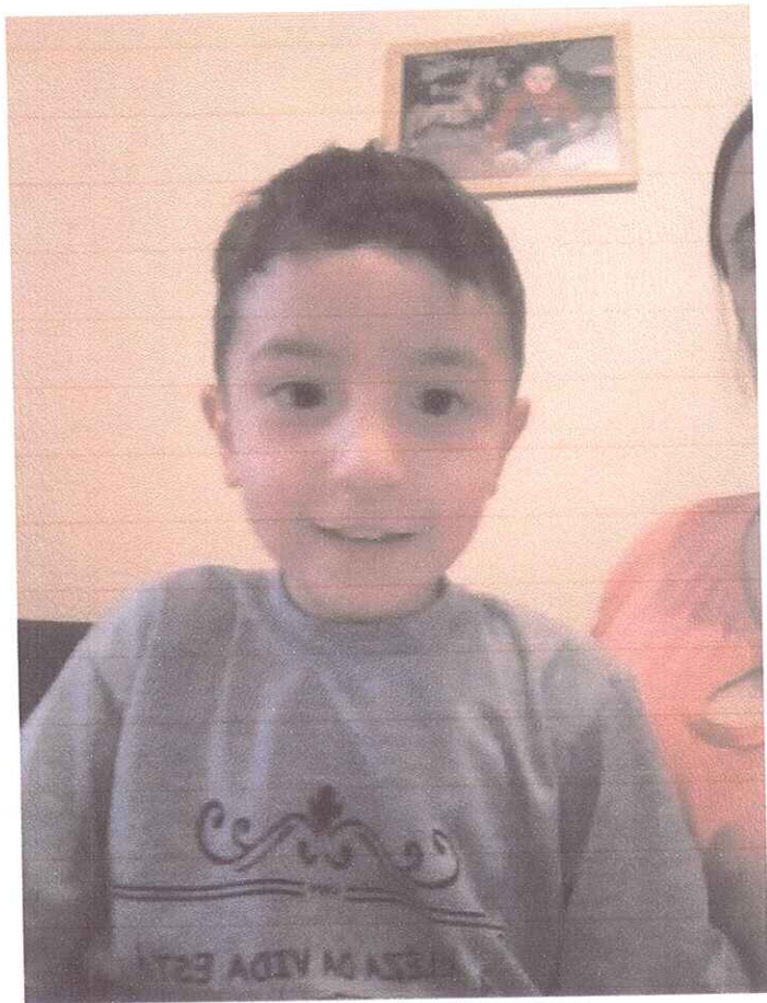
FIGURA 4 - ATENDIDO DA EMEI FAVINHO DE MEL